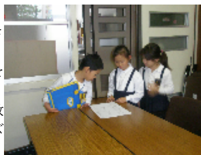
1・2年生活科「学校たんけん」

このように、いろいろな学習をとおして異学年や他校と交流し、1・2年生活科「学校たんけん」お互いのよさを認め合い、高め合うことができる力を伸ばしていきたいです。