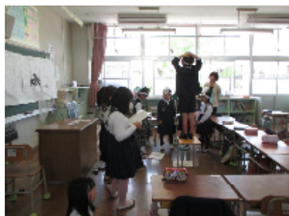
3年生国語「キツツキの商売」