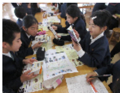
6年生総合「平和学習」