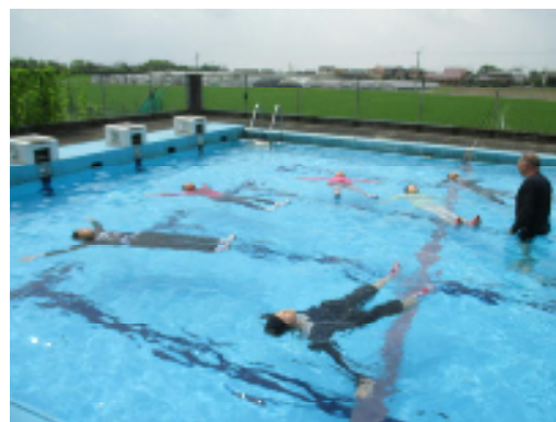
全校：着衣水泳、力を抜いて浮く練習