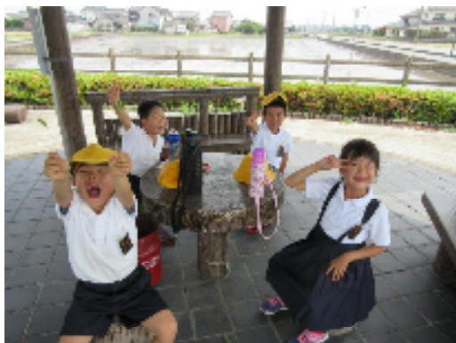
1年生：校区を探検したよ