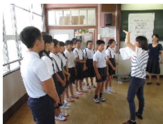
6年生：きれいな声で歌いました