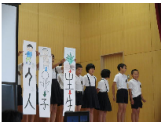
5年生：漢字の成り立ちを調べたよ