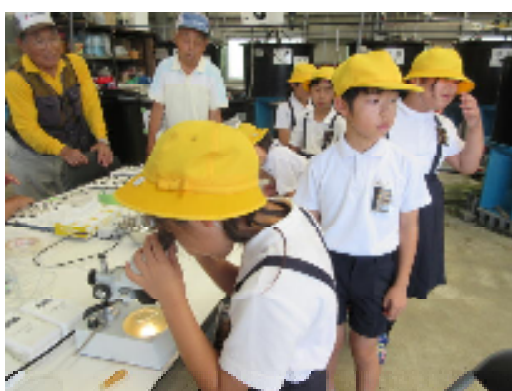
3年生：えつの赤ちゃんを見に行ったよ