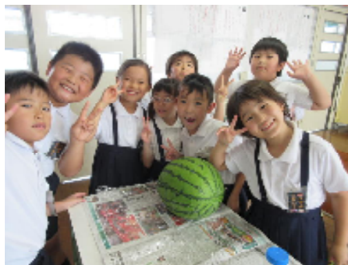
2年生：こんな大きなスイカがとれたよ