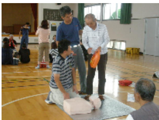
救急法講習会：声をかけあって