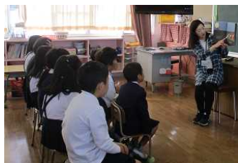
【先生の読み聞かせ】

3学期は読書量を増やすため、図書委員会の皆さんを中心に取り組みました。先生の読み聞かせに加え、図書委員さんの読み聞かせがありました。また、1000ページ毎にお楽しみ抽選券を配布する取組などアイデアを出し合って読書に親しめるようにしました。