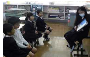
【図書委員さんの読み聞かせ】

1000ページで1枚の抽選券をもって3月2日(月)にくじ引きを行いました。空くじなしで、全員に「しおり」か「ポストカード」のプレゼントがあります。最高は9000ページ読破の2年 さん、3年 さんでした。抽選で1番を引いた人には3月の誕生給食に特別ゲストで招かれる券があたりました。4月からたくさん本を読む意欲を高める取組を行います。これからもたくさんの方に読んでほしいと思います。