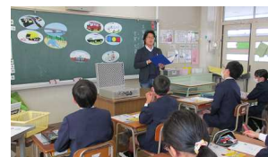
【税に関する授業風景】