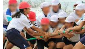
【4・5・6年棒引き・・・引きずられても離すものか】