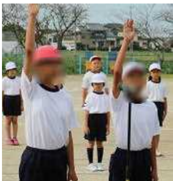
【団長の誓いの言葉で 意気込みを感じます】

地域の皆様、保護者の皆様、早朝より準備・応援・片付けまでご協力いただきまして本当にありがとうございました。