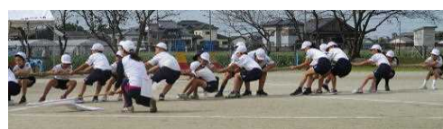
【赤も白も力いっぱい綱を引きました】