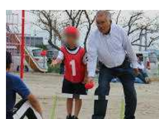
【家族や地域のみなさんとの競技があるのも下田小ならではの！素敵なふれあいの時間でした】