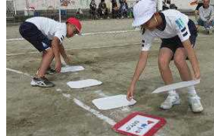
【ただ走るだけでなく運も味方につけないと勝てない下田っ子レース。練習でも順位はいつもかわっていました】