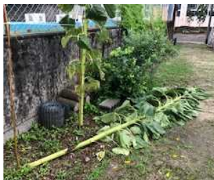
【大きく育ったひまわりも倒れてしまいました】

7月6日(月)から降り続いた雨。これまで経験のないような、激しい雨が長時間降り続き、下田校区内もどこが道なのか分からない状態となりました。皆様のご家庭や田畑の被害は幾ばくかと思うところです。学校の運動場周りも用水路の水が溢れ、道路を越えた水が運動場に流れ込んできました。田んぼが湖のように波打ち、被害の大きさを感じたところでした。保護者の皆様には、6日午後からの緊急下校に伴うお迎え、7日8日の臨時休校と大変お世話をかけました。9日、10日は下校時刻の雷雨に伴い迎えに来ていただきとても助かりました。学校では、昨年から緊急事態に備えた防災マニュアルを作成しておりましたが、今回の豪雨時にはうまく機能することができませんでした。確実に子ども達を引き渡すため、再度防災マニュアルを見直して改善していきます。保護者の皆様の迅速なお迎え対応に心より感謝いたします。ご協力ありがとうございました。