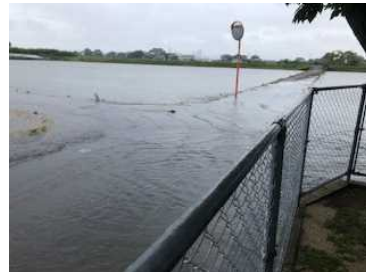
【運動場の周りは湖のようでした】