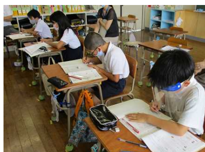
【しっかり考えをノートに書いている5年生】