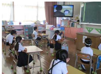
【1年生：さよならかばくんの学習、折鶴作り】