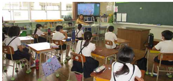
【23年生：かわいそうなぞうの学習】